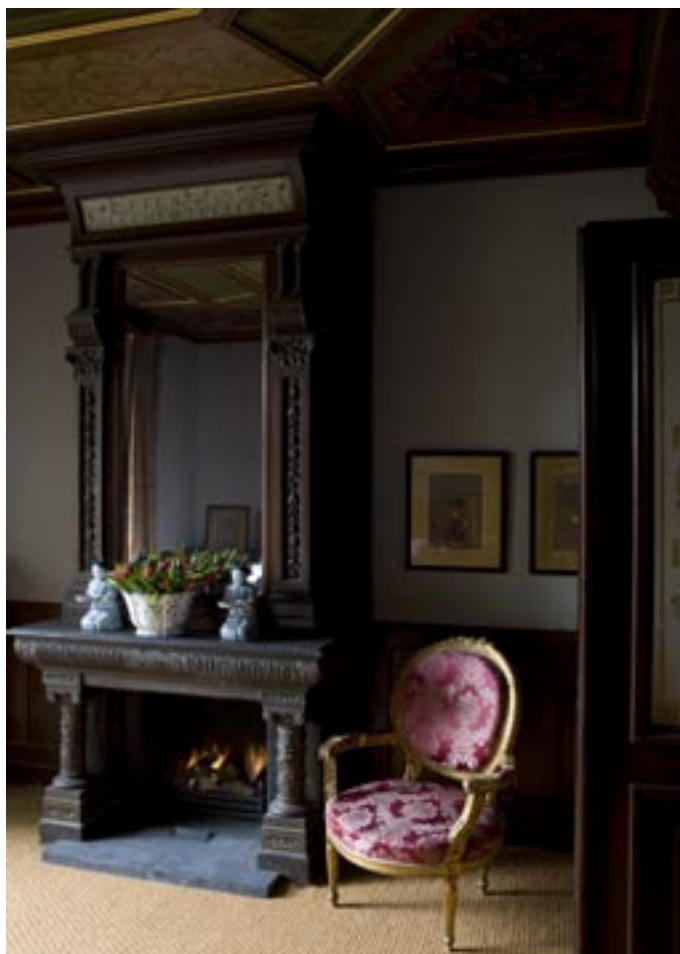
Slaapkamer met tegeltableau boven de schouw. Linkerpagina: Woonkamer met familieportret. Openingspagina's, links: De spectaculaire voorgevel. Rechts: Atelier met een doorkijkje naar de gang.