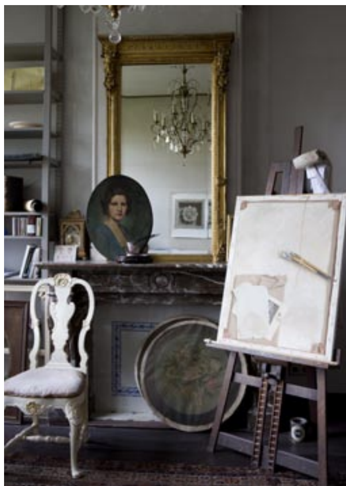
Atelier. Rechterpagina, met de klok mee: Trappenhuis. Kleedkamer met naakt. Plafond met verwijzingen naar de vrijmetselarij. Suitedeuren naar de slaapkamer.