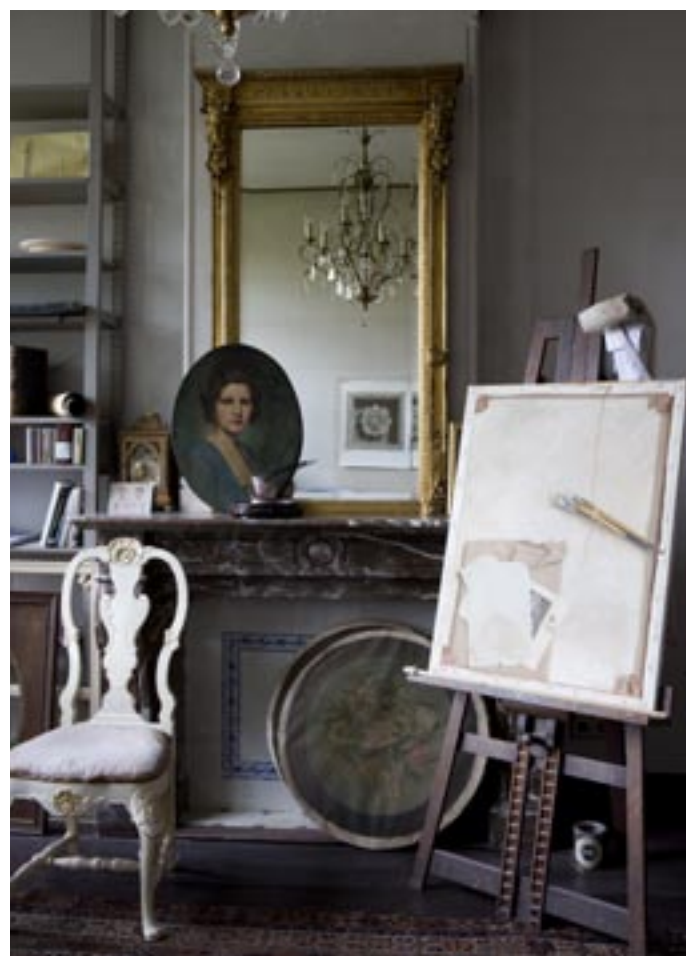
Atelier. Rechterpagina, met de klok mee: Trappenhuis. Kleedkamer met naakt. Plafond met verwijzingen naar de vrijmetselarij. Suitedeuren naar de slaapkamer.